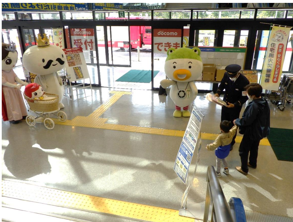
令和4年秋の火災予防運動 家電量販店での住宅用火災警報器に関する広報活動