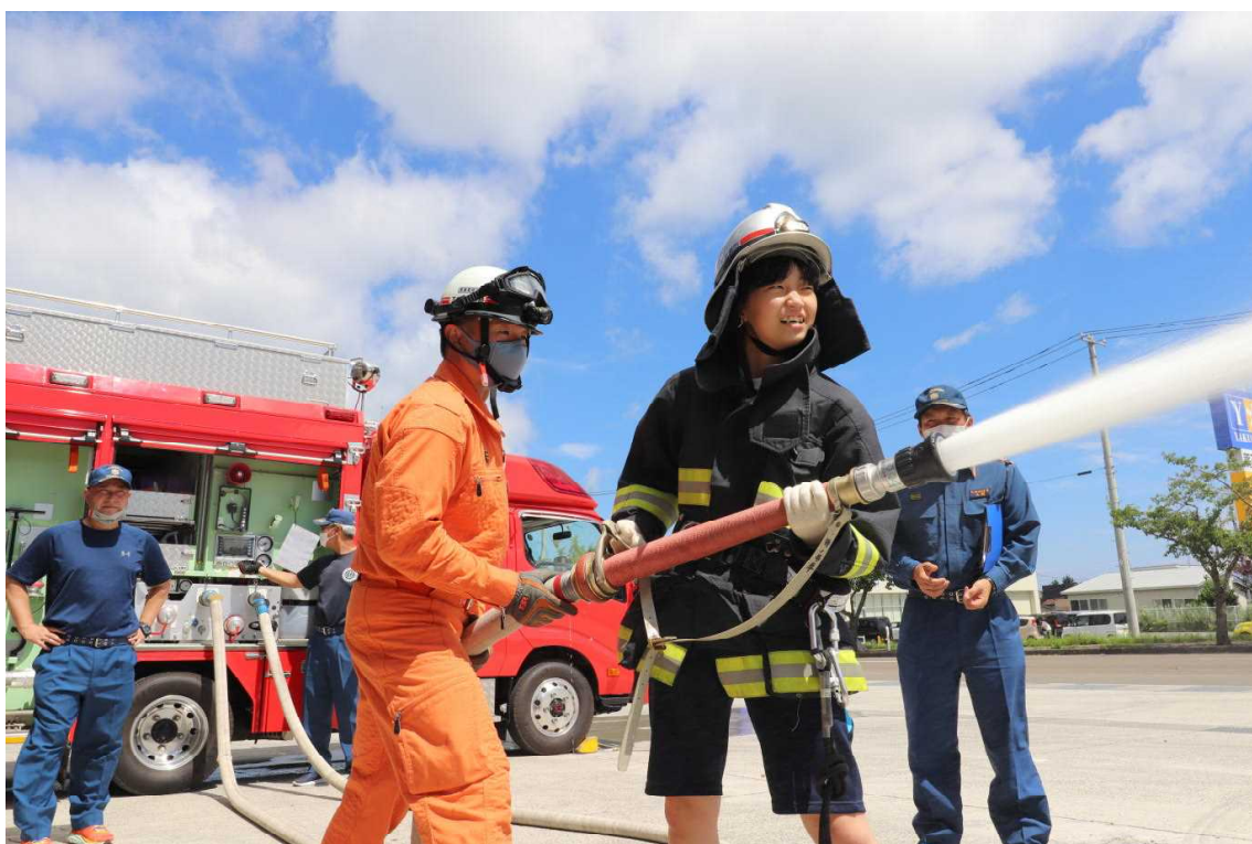
小目名ひばの子森林警備隊夏休み消防体験学習