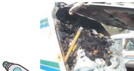
パッカー車火災状況

カセット式ボンベやスプレー缶等は「必ず中身を使い切り、穴を開けて」から出してください。