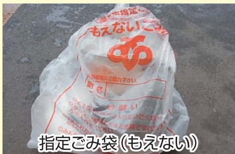
指定ごみ袋(もえない)